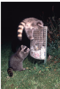
„Reiche Beute“ erwartet die Waschbären an Mülleimern.

Der Waschbär ( Procyon Lotor ) ist ein Vertreter der Familie der Kleinbären und gehört zur Ordnung der Raubtiere. Charakteristische Merkmale des Kleinbären sind seine etwas gedrungene und bucklige Gestalt, die Gesichtsmaske mit einer über der Augenregion verlaufenden braunschwarzen Binde und der grau schwarz querringelte Schwanz. Seine Fellfärbung kann sehr unterschiedliche Variationen von Grautönen aufweisen und ist häufig silbergrau untermischt.