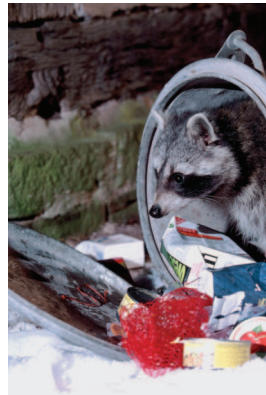
Auf der Suche nach Fressbarem durchwühlen Waschbären allzu gerne auch Mülleimer.

Auch Findelkinder aufzuziehen und später wieder frei zu lassen ist leichtfertig und unbedacht. Ein Waschbär ist kein Haustier und wird auch keins.