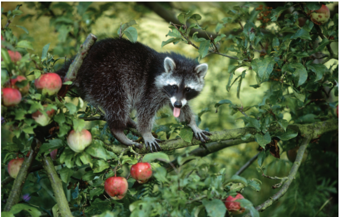
Reifes Obst lockt Waschbären besonders an.

Als 1966 eine US-Air-Force-Einheit ihren Stützpunkt in Frankreich, nahe der Stadt Laon im Departement Aisne, im Zusammenhang mit dem Vietnamkrieg unerwartet aufgeben musste, ließen die Soldaten ihre Waschbärmaskottchen zurück. In den um die Stadt angrenzenden Wäldern entwickelte sich auf diese Weise schnell eine eigenständige Waschbärenpopulation. In Weißrussland und im Kaukasusgebiet wurden in den 1930er und 1950er Jahren des vorigen Jahrhunderts erfolgreiche Ansiedlungen des Waschbären durchgeführt. In ganz Europa wird der Waschbärbestand mittlerweile auf einige Hunderttausend geschätzt.