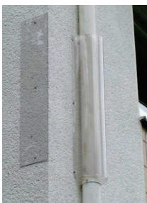
Effektiver Waschbär- Abweiser, der einen Aufstieg verhindert.