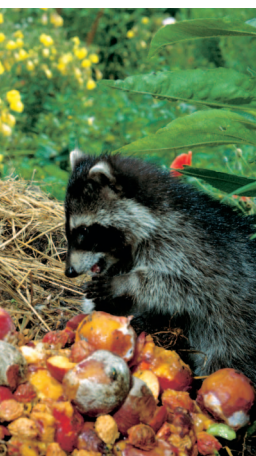
Einen reich gedeckten Tisch finden die Waschbären vor allem auf dem Kompost.

Die knapp 10 cm großen Neugeborenen haben bei der Geburt ein Gewicht von 65 bis 75 g. Sie werden nur von der Mutter großgezogen und verlassen ihre Höhle gegen Ende des zweiten Monats. Bis zum Herbst leben sie im Familienverband. Waschbären sind keine Einzelgänger, sondern leben ganzjährig mit Artgenossen in Gruppenverbänden zusammen. Es lassen sich Mutter-Kind-Gruppen, Bündnisse von erwachsenen Rüden sowie Gruppen von erwachsenen Fähen unterscheiden.