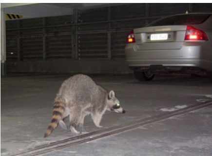
Waschbär in Parkhäusern – längst keine Seltenheit mehr.