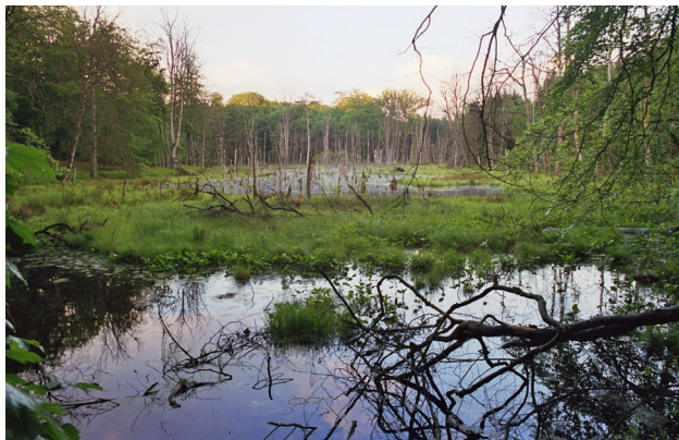
Abb. 4 Niedermoorkomplexe wie dieses Stauwasser- Versumpfungsmoor machen einen Großteil der Habitatstrukturen im Untersuchungsgebiet aus, Müritz- Nationalpark Juli 2006.