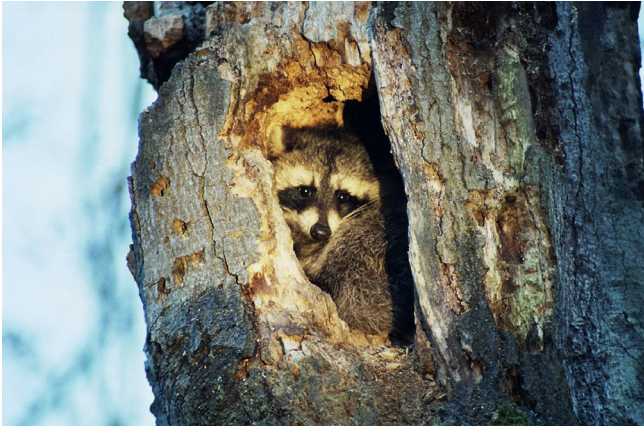
Abb. 2 Höhlenschlafplatz eines sender- markierten Jungtiers (6) in einer toten Buche, Müritz- Nationalpark Juli 2006.