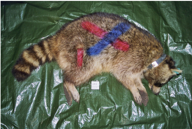
Abb. 3 Narkotisierter Rüde mit UKW- Senderhalsband und individueller Farbmarkierung. Müritz-Nationalpark September 2007.